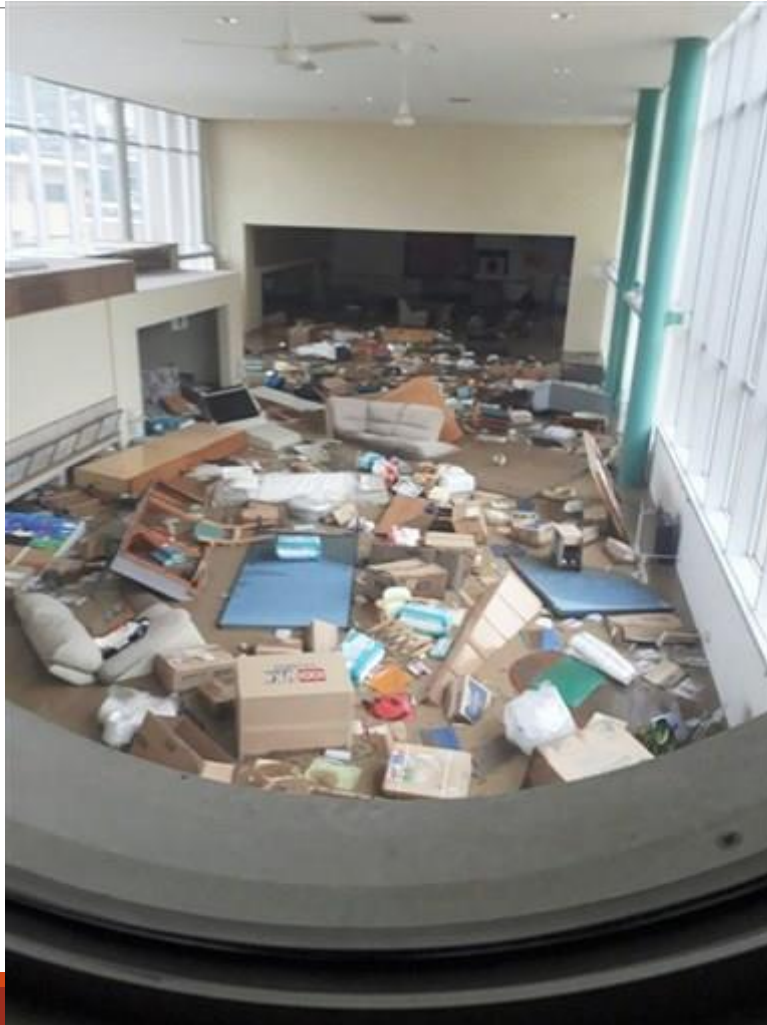
球磨村特別養護老人ホーム 千寿園一階